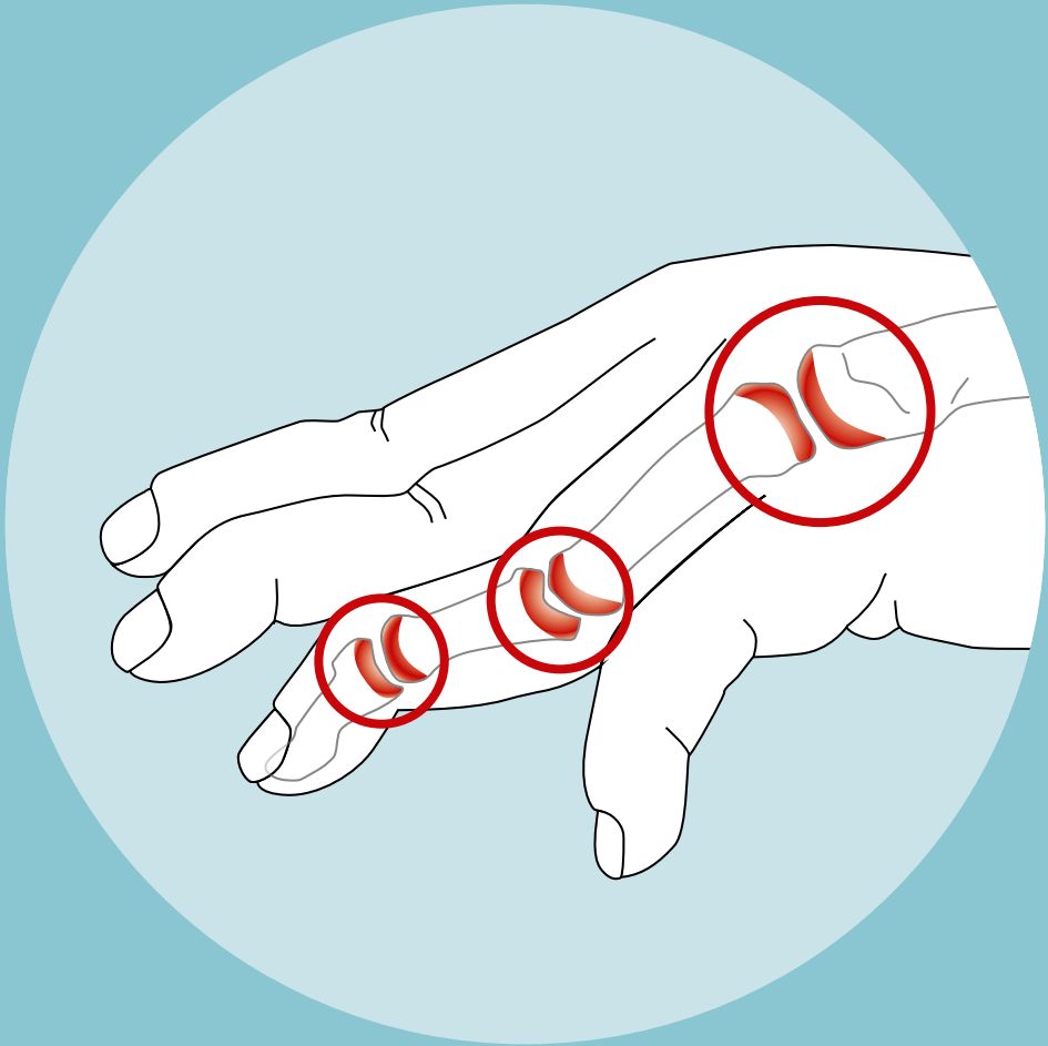
Abb. 1 Vereinfachte schematische Darstellung entzündeter Gelenke der Hand bei Psoriasis-Arthritis